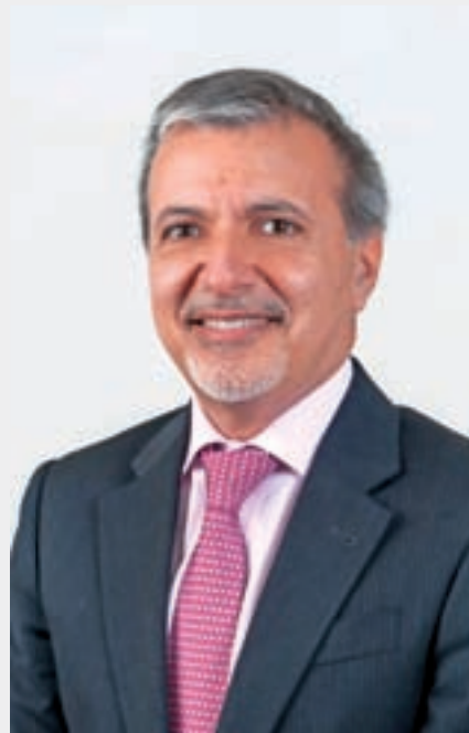
Por Francisco Selamé M., Socio PwC.